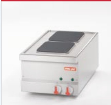
BistroLine 2 Platten Elektro-Herd zum Kochen und Braten