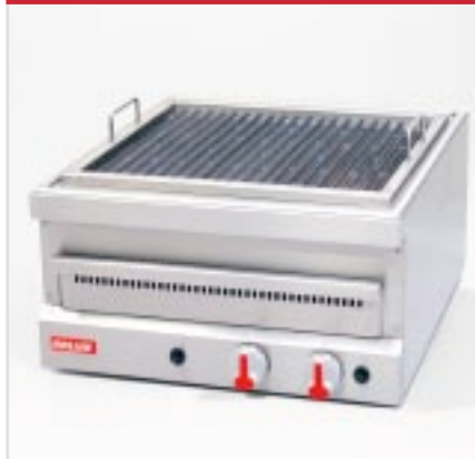
BistroLine Gas Grill zum Grillen und Braten