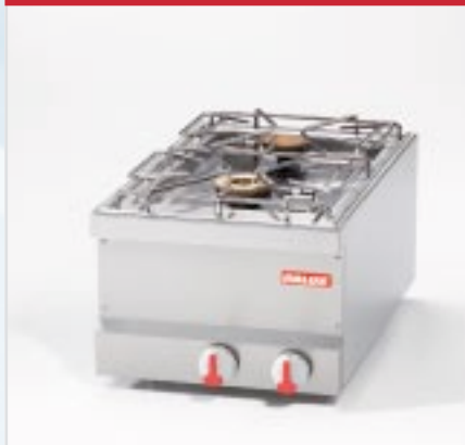
BistroLine 2-Flammen Gasherd zum Kochen und Braten