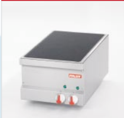
BistroLine Ceranherd zum Kochen und Braten