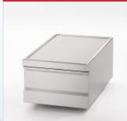
BistroLine Arbeitsplatte (1/2) als Arbeits- und Abstellfläche