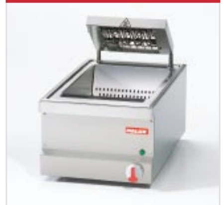
BistroLine Frittenwanne GN 1/1 zum Warmhalten von Frittiertem