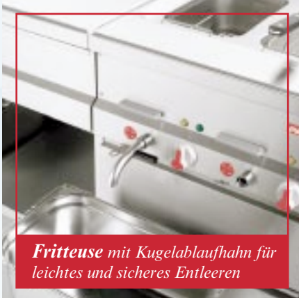
Fritteuse mit Kugelablaufhahn für leichtes und sicheres Entleeren