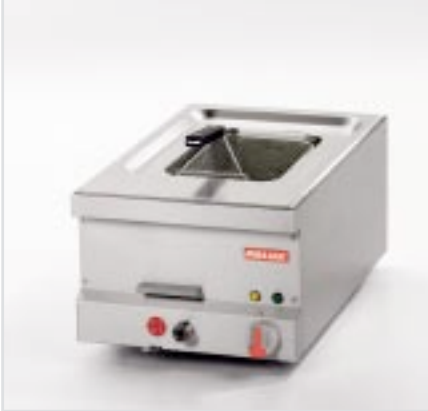
BistroLine Einbecken-Fritteuse für gesundes, fettarmes Frittieren