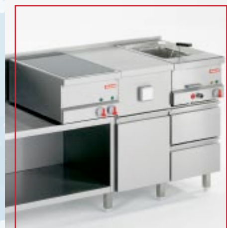
PALUX BistroLine-Zeile Typ 1 – für die individuelle, flexible Aufstellung je nach Kapazität und aktuellem Speisenangebot auf geschlossenem Unterbausystem mit Hygieneabdeckung.