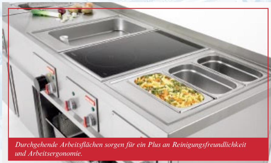
Durchgehende Arbeitsflächen sorgen für ein Plus an Reinigungsfreundlichkeit und Arbeitsergonomie.