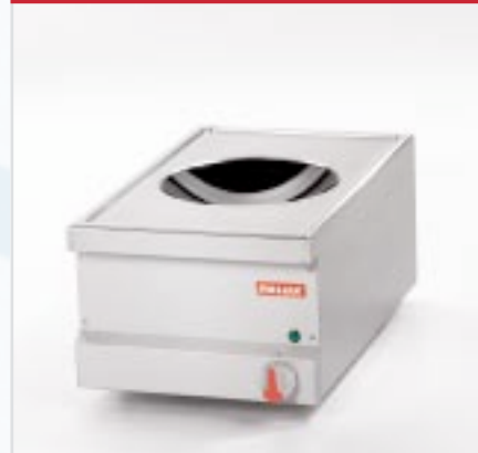
BistroLine Induktionswok (1/2) für die gesundheitsbewusste Küche