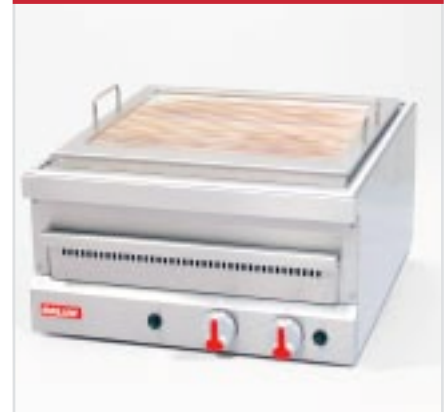
BistroLine Gas Glühsteingrill zum Grillen und Braten