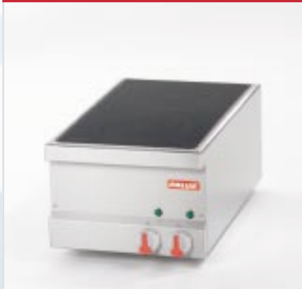
BistroLine Induktionsherde (1/2) zum Kochen und Braten