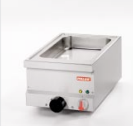
BistroLine Bräter 400 Braten, Kochen, Dünsten, Schmoren