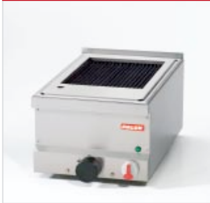
BistroLine Steakgrill 400 zum Grillen und Braten