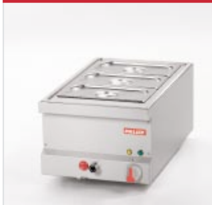
BistroLine Wasserbad GN 1/1 zum schonenden Warmhalten