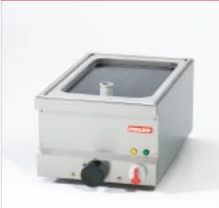
BistroLine Bratplatte 400 zum Braten und Grillen