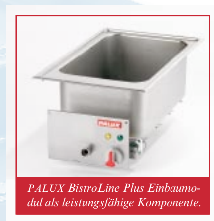
PALUX BistroLine Plus Einbaumodul als leistungsfähige Komponente.

Ein praxisgerechtes, modulares und variables Unterbausystem ermöglicht perfekte, bedarfsgerechte Kombinationen. Die PALUX BistroLine Plus Unterbauten , in Standard oder Hygiene, bieten verschiedenste Funktionen in zahlreichen Ausstattungsvarianten. Dazu viele nützliche Details.