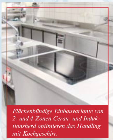
Flächenbündige Einbauvariante von 2- und 4 Zonen Ceran- und Induktionsherd optimieren das Handling mit Kochgeschirr.